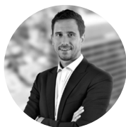
Esc. Diego Cervieri